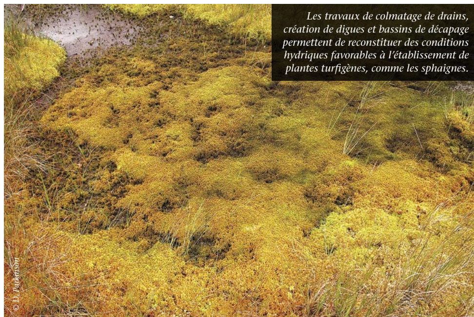
Les travaux de colmatage de drains, création de digues et bassins de décapage permettent de reconstituer des conditions hydriques favorables à l'établissement de plantes turfigènes, comme les sphaignes.

Ces travaux sur les hauts-plateaux initient aussi la restauration du fonctionnement de ces écosystèmes humides. Si les zones tourbeuses des sommets et des cols contribuent assez peu à une restauration des flux hydriques, l'ensemble des travaux comme l'élimination des drains et des collecteurs dans le lit majeur des cours d'eau, ne peut que les stabiliser. Les surfaces restent encore limitées, mais les travaux réalisés montrent la direction à suivre puisqu'encore au moins 10000 à 15000 hectares de