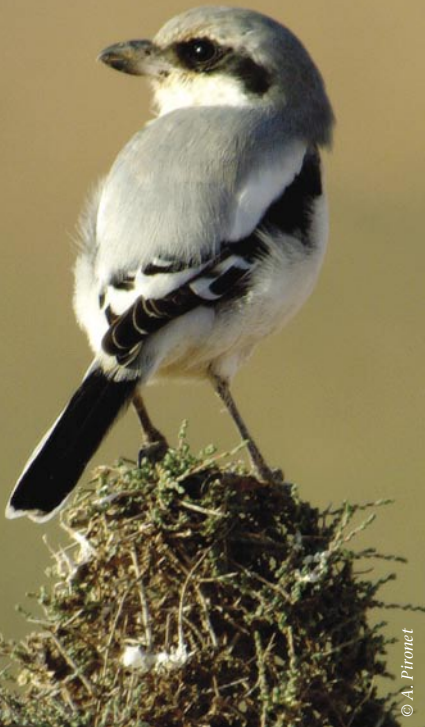
Pie grièche grise.

La première étape du projet LIFE Ardenne liégeoise est donc d'enrayer la spéculation sylvicole résineuse. En effet, depuis le milieu du XIX e siècle, de nombreux investissements ont été réalisés par les pouvoirs publics ou les propriétaires privés pour essayer de mettre en valeur les terres incultes (notamment les zones humides et tourbeuses) en les plantant de résineux, et essentiellement l'épicéa. L'on se rend compte aujourd'hui que ces plantations sur des sols très hydromorphes à tourbeux ne sont pas ou peu rentables. Ce type de plantations a nécessité de lourds travaux de drainage et une main d'œuvre importante pour les éclaircir et les élaguer. Il engendre des difficultés d'exploitation, subit des attaques de scolytes et est soumis aux chablis. L'abandon de la sylviculture résineuse sur ce type de sol est alors réalisé au profit de la reconstitution des milieux naturels d'origine (tourbière haute, boulaie tourbeuse...) ou de milieux semi-naturels (lande, pré maigre...). À travers le projet LIFE Ardenne liégeoise, ce sont minimum 250 hectares de plantations résineuses sur sols marginaux qui seront éliminées. Pour atteindre cet objectif, le projet LIFE fera