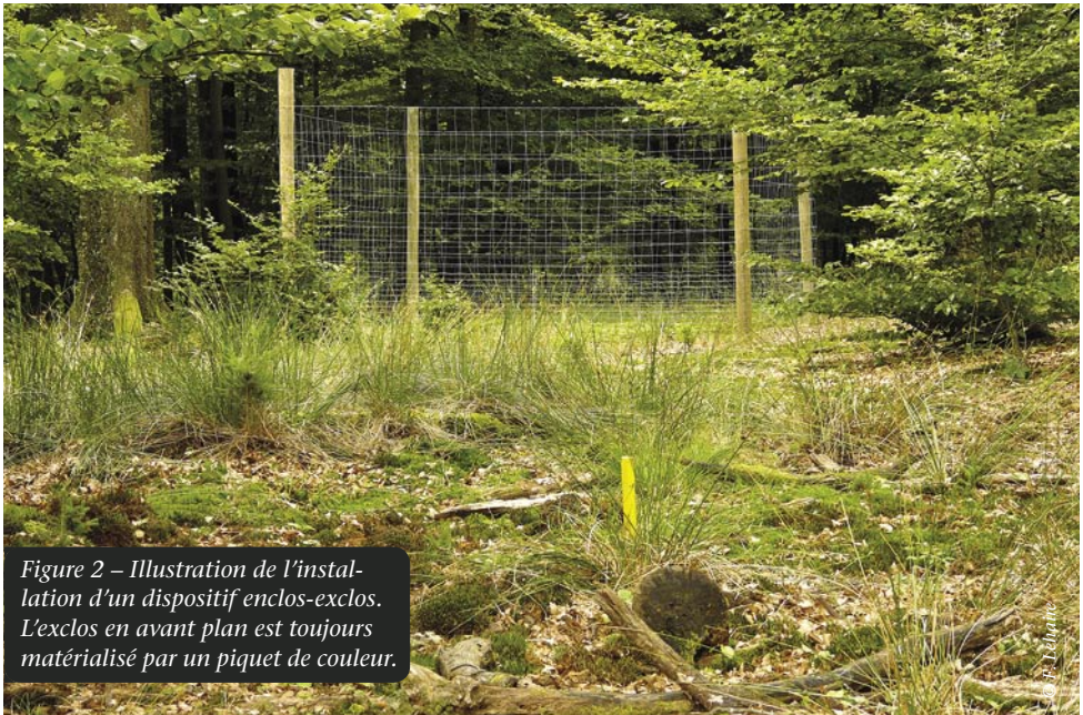
Figure 2 – Illustration de l'installation d'un dispositif enclos-exclos. L'exclos en avant plan est toujours matérialisé par un piquet de couleur.

Le principal intérêt des dispositifs enclos-exclos est leur aspect didactique. C'est pourquoi, un dossier photos doit être mis en place dès leur installation pour per-