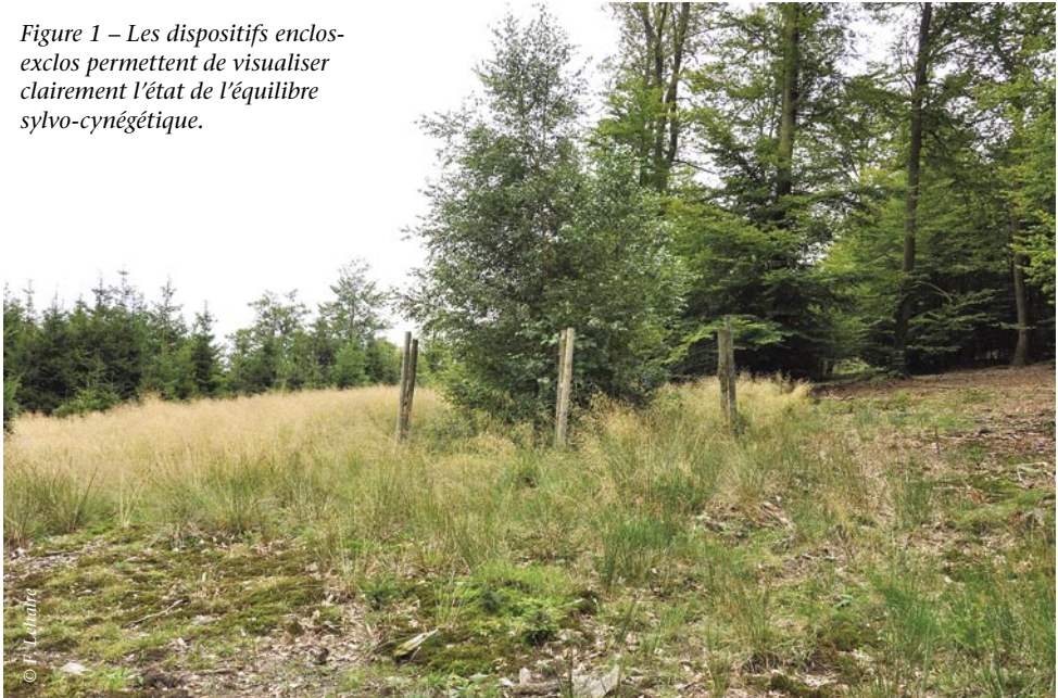
Figure 1 – Les dispositifs enclos-exclos permettent de visualiser clairement l'état de l'équilibre sylvo-cynégétique.

dance des cervidés sur la régénération forestière 6 . Depuis lors, leur utilisation s'est fortement développée, tant au niveau de la recherche scientifique qu'au niveau de la gestion proprement dite.