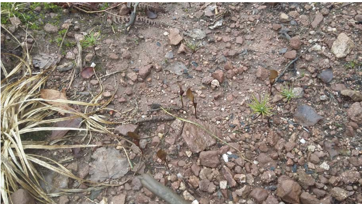
Figure 9. En mars 2017, les semis de pin ont 1 an, les graines de sapin arrivées naturellement germent.

Dans notre cas, la réalisation de banquettes de 1 mètre de large environ espacées de 2,5 mètres re-