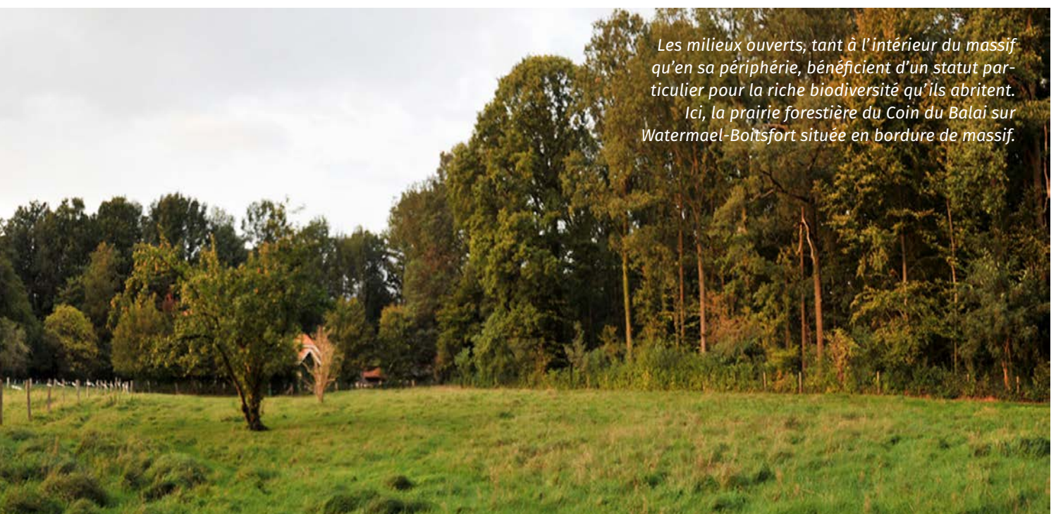
Les milieux ouverts, tant à l'intérieur du massif qu'en sa périphérie, bénéficient d'un statut particulier pour la riche biodiversité qu'ils abritent. Ici, la prairie forestière du Coin du Balai sur Watermael-Boitsfort située en bordure de massif.

Une charte graphique interrégionale commune « Forêt de Soignes » a également été développée. Elle doit