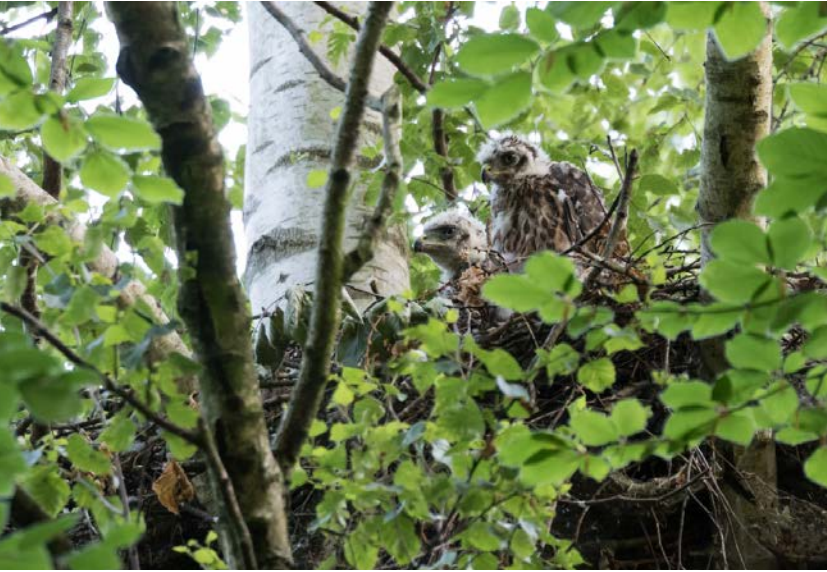
La forêt de Soignes abrite une riche biodiversité dont une population importante d'Autour des palombes (Accipiter gentilis).

intérêt particulier pour la Belgique. Au niveau des lichens, 71 espèces ont été identifiées.