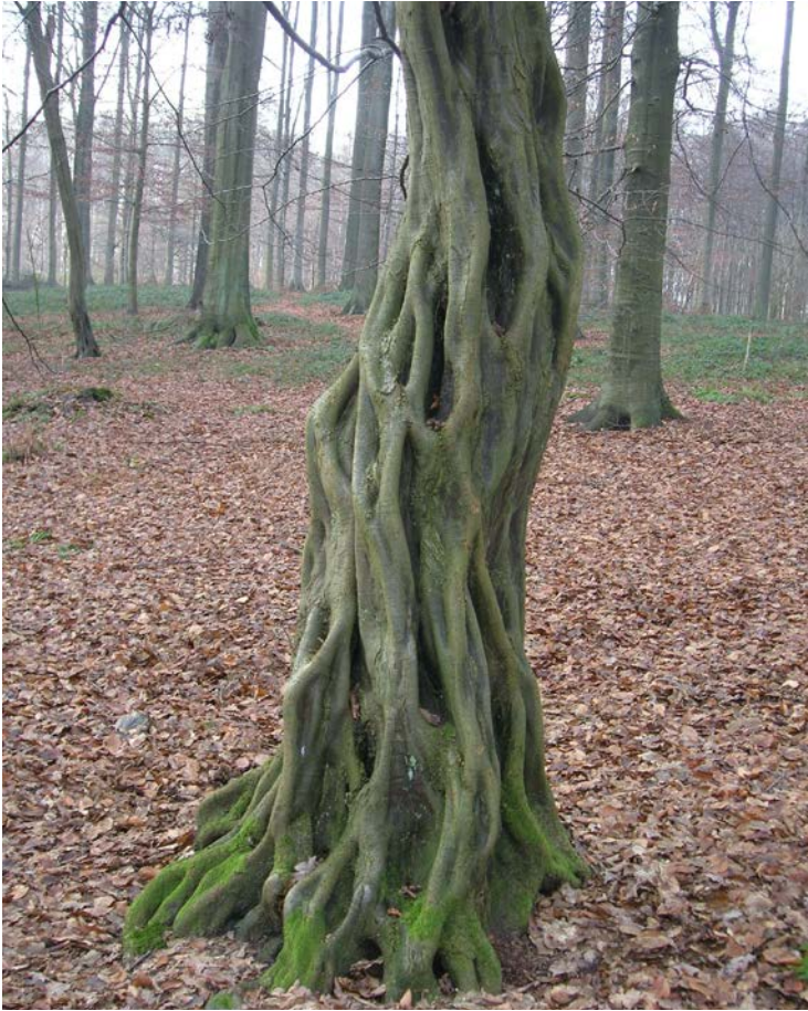
Un inventaire a permis d'identifier 144 arbres remarquables ou curieux sur le massif. Ici, un charme remarquable par sa forme situé dans le vallon du Grasdelle sur Uccle.

contribuer, avec la « charte mobilier », à développer une identité propre à la forêt de Soignes, indépendamment des Régions où elles se trouvent.