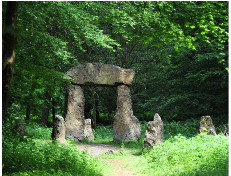
La forêt de Soignes abrite de nombreux monuments. Ici le monument dédié aux forestiers morts pendant la guerre 14-18 réalisé en 1921 par l'artiste Richard Viandier.

L'installation de mobilier sera concentrée au sein des portes et dans la zone directement autour des portes. Plus on s'éloignera des portes, moins le mobilier sera présent, pour être absent au cœur du massif. Le nombre de places de parking sera maintenu mais sera concentré au maximum à proximité directe des portes d'accueil.