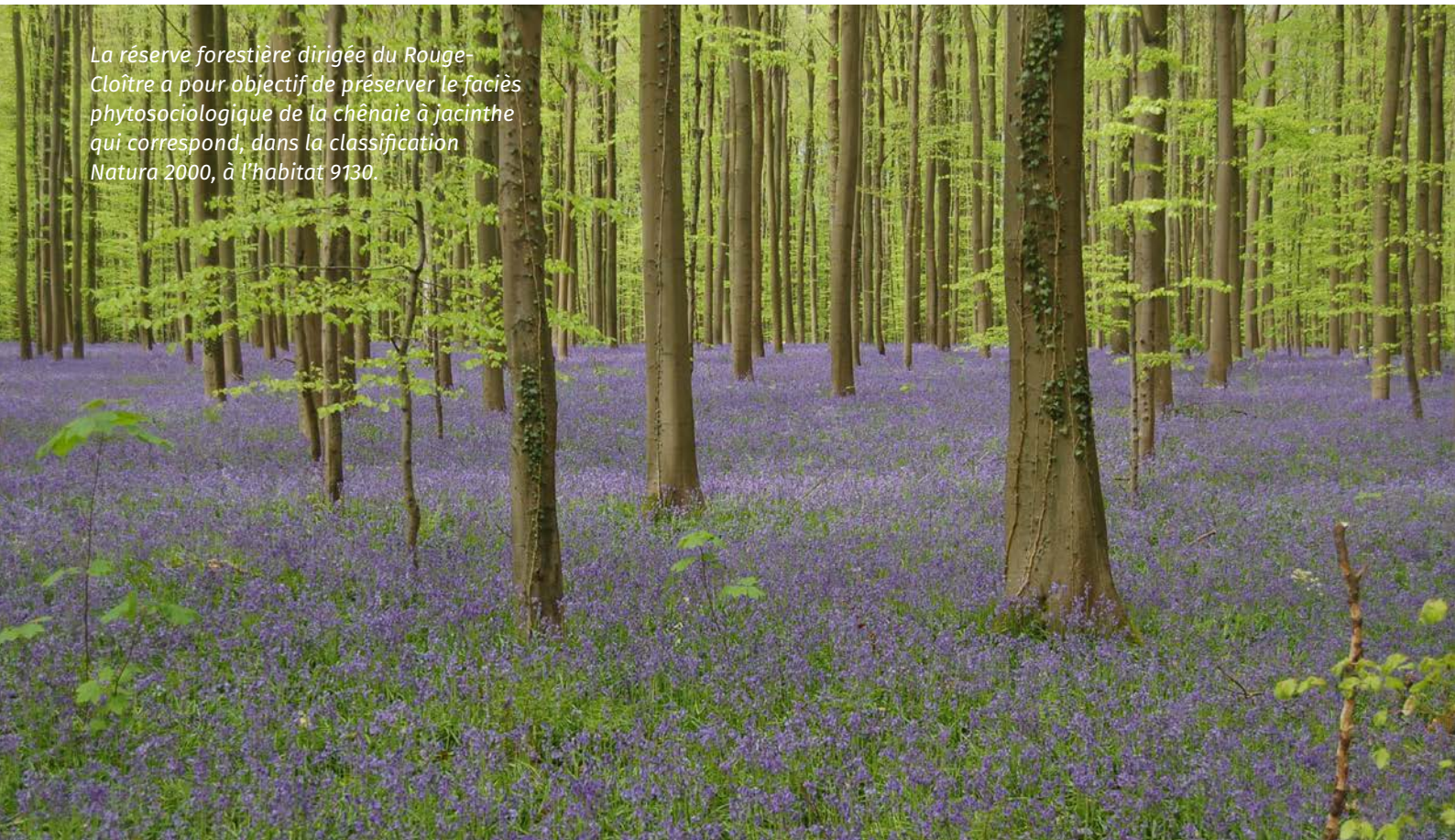
La réserve forestière dirigée du Rouge-Cloître a pour objectif de préserver le faciès phytosociologique de la chênaie à jacinthe qui correspond, dans la classification Natura 2000, à l'habitat 9130.

Au niveau de la production de bois, l'objectif du plan de gestion reste la production d'un bois de qualité s'appuyant sur une sylviculture d'arbres-objectifs détournés lors des martelages successifs. Cette sylviculture dynamique devra permettre de faire évoluer les jeunes peuplements équiennes monospécifiques